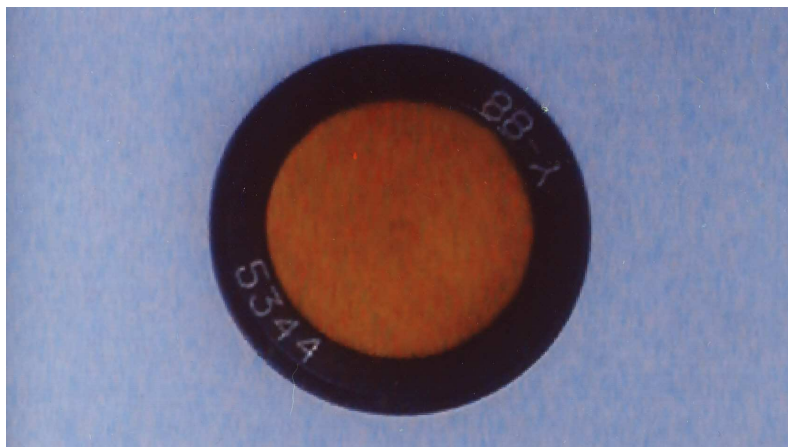
Рис.1 Фотография общего вида источника ОСГИ-3

Активная часть источника имеет диаметр не более 3 мм и очень малую толщину, что позволяет считать источник точечным без самопоглощения при реальных геометриях измерений фотонного излучения на спектрометрах и радиометрах.